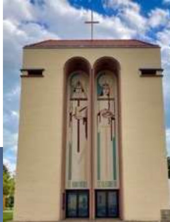
Kirche St. Elisabeth Quedlinburger Str. 4 06493 Ballenstedt