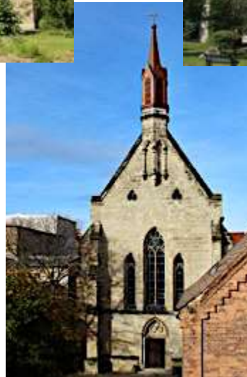
Kirche Herz-Jesu Walther-Rathenau-Str. 2 06502 Thale