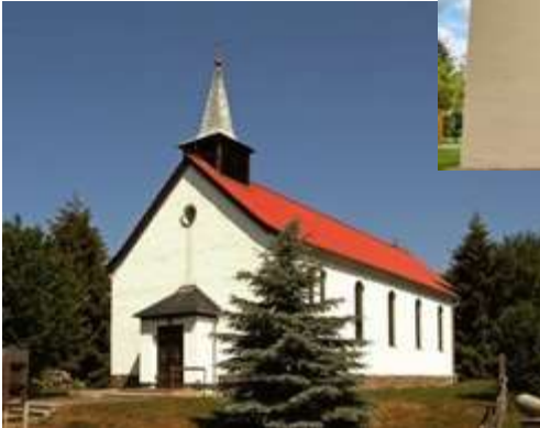
Kirche St. Johannes Baptist Alexibader Str. 6 06493 Harzgerode